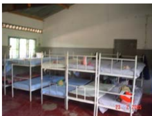
... e por dentro!