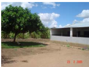
O dormitório por fora...