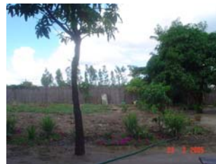
A machamba (quinta)